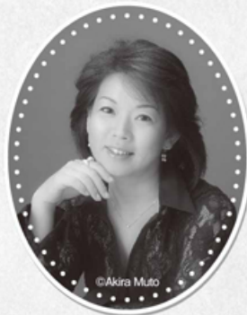
ソプラノ 天羽 明恵 Akie Amou

超絶的なコロラトゥーラとリリックな声を併せ持ち、内外で高い評価を得ているソプラノ歌手。95年ソニア・ノルウェー女王記念国際音楽コンクール優勝。ジュネーヴ大劇場、ザクセン州立歌劇場、ベルリン・コーミッシェ・オーパー等ヨーロッパ各地の歌劇場や音楽祭に出演。国内でも新国立劇場、サントリーホール・ホールオペラなどへ定期的に登場し、主要なオーケストラの定期公演にもソリストとして出演している。1999年度アリオン賞、2003年新日鉄音楽賞フレッシュアーティスト賞受賞。サントリーホール・オペラアカデミーのコーチング・ファカルティとして、若手の指導にも力を入れている。日本ロシア二協会運営委員。