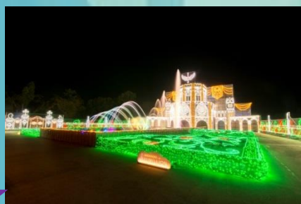
さがみ湖イルミオン2017~2018