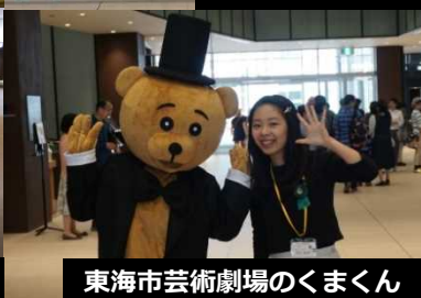
東海市芸術劇場のくまくん