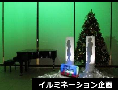
イルミネーション企画