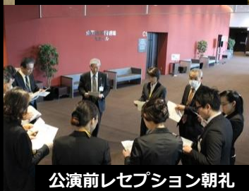
公演前レセプション朝礼