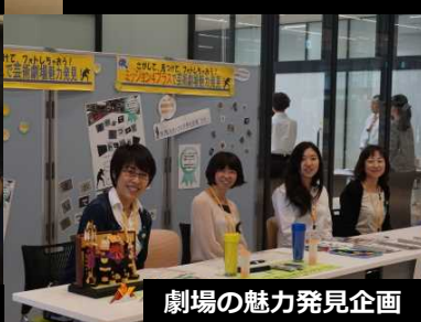
劇場の魅力発見企画