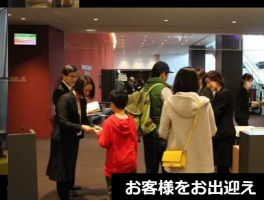
お客様をお出迎え