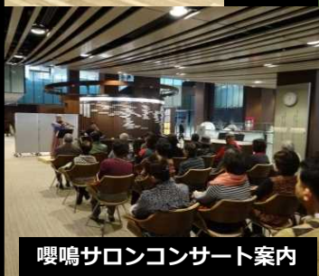
嚶鳴サロンコンサート案内