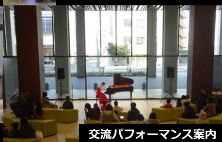
交流パフォーマンス案内