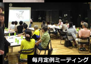
毎月定例ミーティング