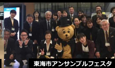
東海市アンサンブルフェスタ