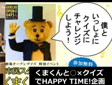
劇場オープンデイズ 特別イベント 参加無料 市民スタッフ企画 くまくとクイズでHAPPY TIME!企画