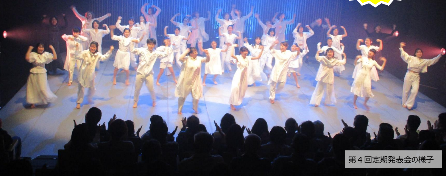
第4回定期発表会の様子

日本を代表するダンス・カンパニーMemorable Momentを指導者に迎え、 力のあるダンスチームを目指し、ダンスの技術や表現力を学んでいきます。